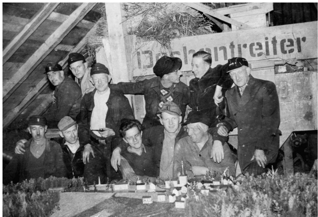
1954 Die Büchelhagener Erntewagenbauer