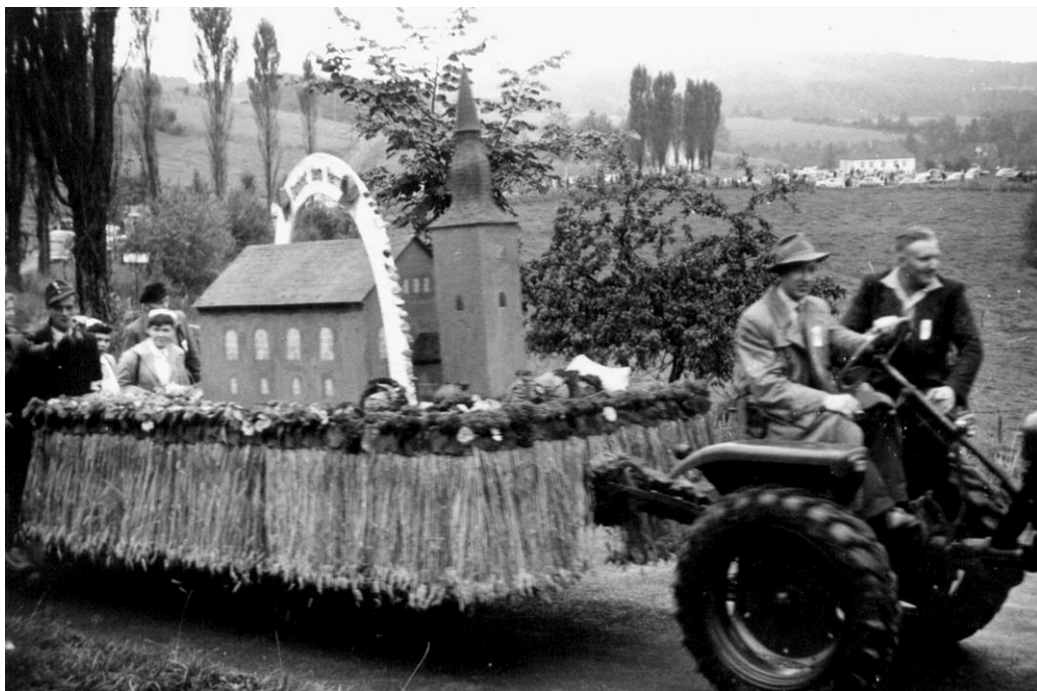
1956 Büddelhagen baut die Drabenderhöher Kirche mit Glockengeläut