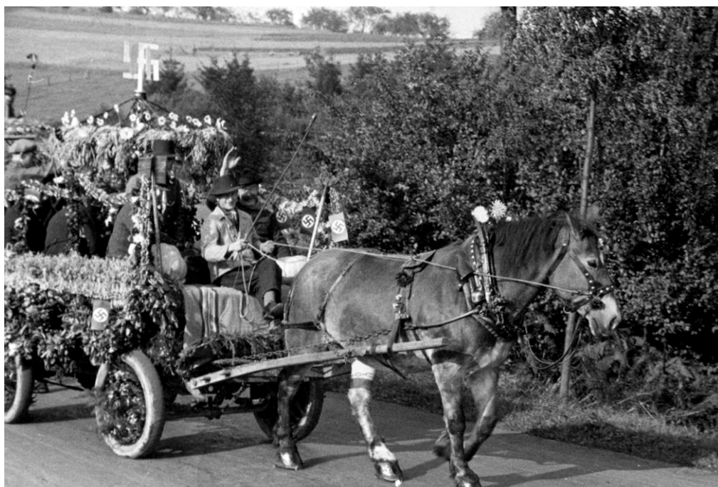
1936 Erster Erntewagen aus Büddelhagen