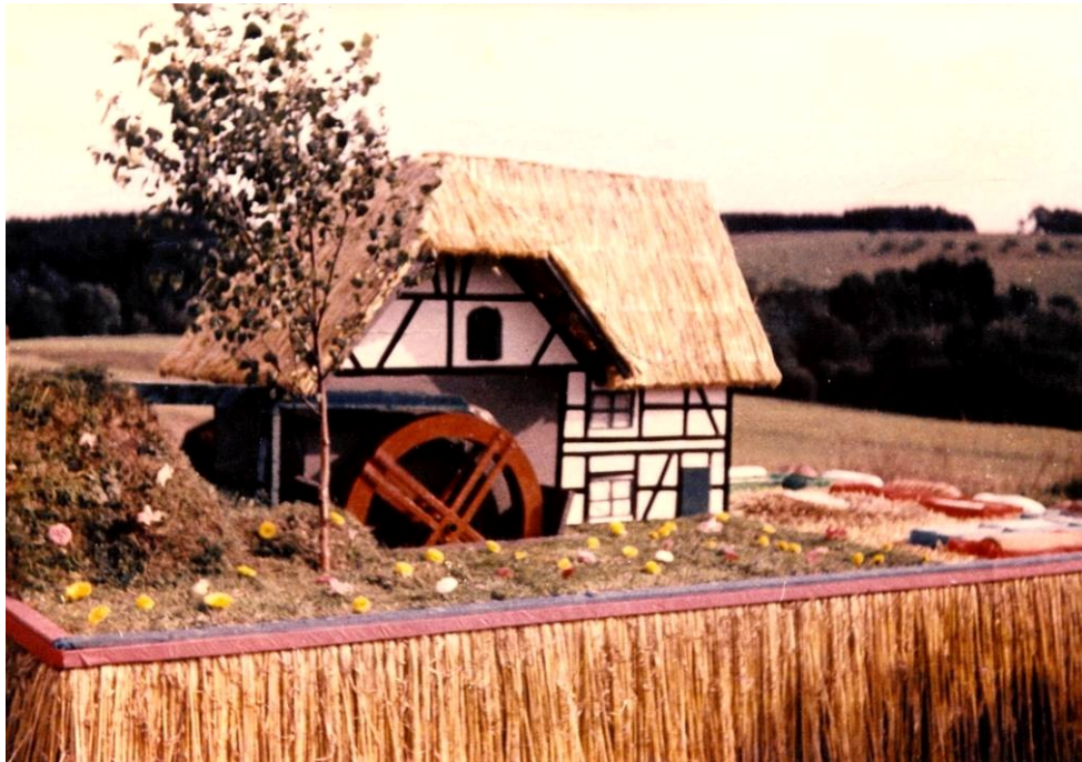
1955 Die Mühle aus Büddelhagen (1. Preis)