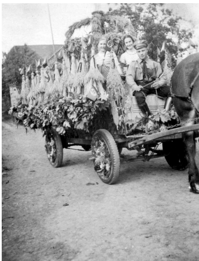
1937 Preisgekrönter Erntewagen aus Büddelhagen